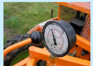
Abb. 3: Schrittzähler (oben) Abb. 4: Druckanzeige (unten)