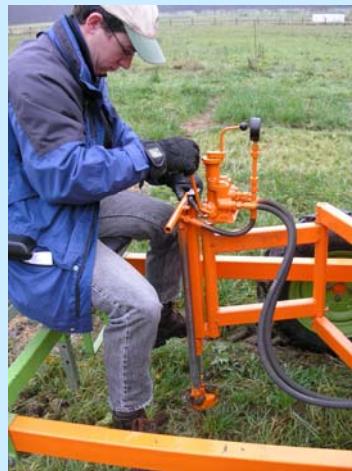
Abb. 2: Bedienung der mechanischen Rinderklaue