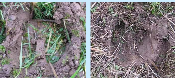
Abb. 7 u. 8: Zum Vergleich die Abdrücke der mechanischen (links) und einer echten Rinderklaue – auch augenscheinlich ein realistisches Ergebnis

Scherwiderstandsmessungen mit einem Flügelbohrer [3] in 10 cm Bodentiefe zeigen einen signifikanten Unterschied zwischen behandelten und unbehandelten Parzellen. Der Tritt verdichtet feuchten Boden bereits nach einmaliger Behandlung, so dass der Scherwiderstand erhöht wird.