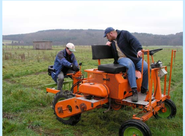
Abb. 1: Versuchsgeräteträger HEGE 75 mit angebauter mechanischer Rinderklaue