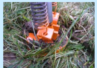
Abb. 6: Einsatz der mechanischen Rinderklaue